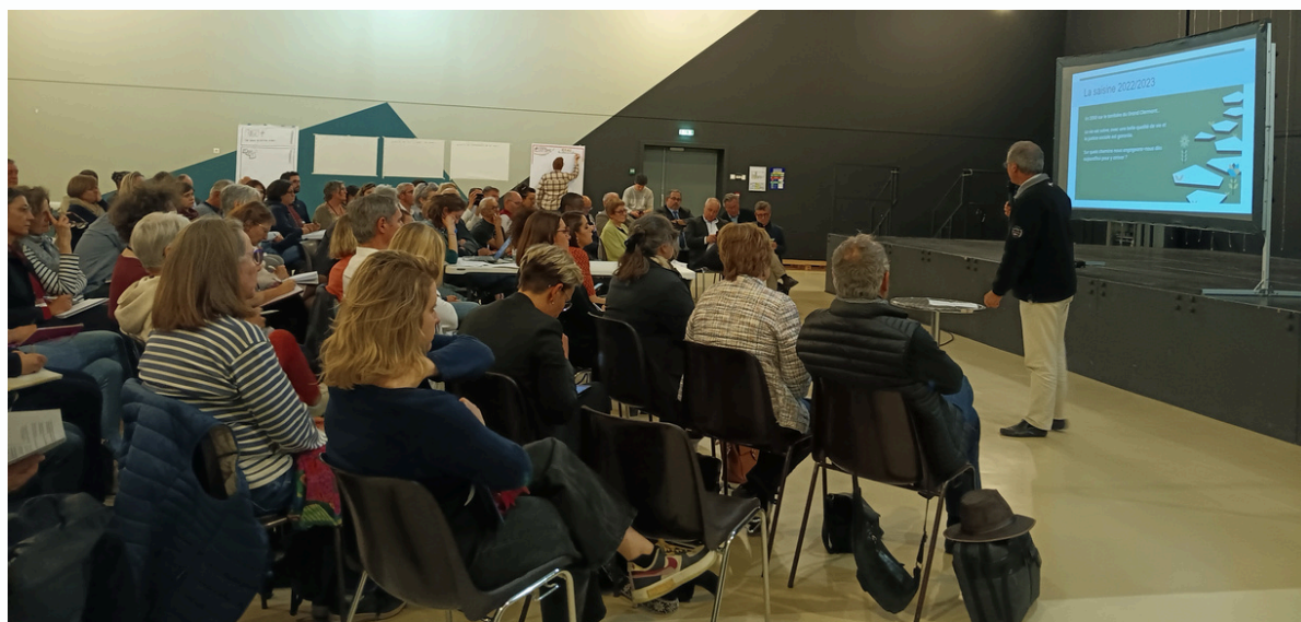
Le 21 mars 2024 à Lempdes

En guise de réponse, les élus ont démontré la prise en compte des aspirations citoyennes en mettant en avant les convergences qu'elles ont avec les enjeux identifiés par la Commission Urbanisme pour le futur SCoT. Pour plus d'informations, voir la délibération n°817 et son annexe du 27 mars 2024, disponible sur le site internet du Grand Clermont.